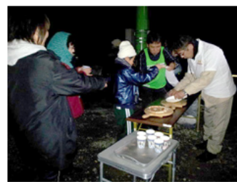
『再生の里ヤルキタウン』の様子